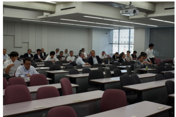
写真—1 本特別セッション開始15分前の会場の様子

本特別セッションのプログラムは、表—1に示す通りである。はじめに東畑郁生地盤工学会会長から、文部科学省「国家課題対応型研究開発推進事業」『廃止措置等基盤研究・人材育成プログラム委託費』2014年度研究成果