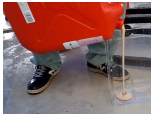
写真-1 開発中の超重泥水の粘性流体的挙動

現場で危険を帯びている放射線には、ガンマ線と中性子線の二種類がある。前者は質量の大きい物質を透過しにくく、後者は水（水素原子）による遮蔽が有効である。これら二つの遮蔽性能を兼ね備えた材料として、超重泥水の開発を行っている。この泥水は粘性流体である（写真-1）。そして放射能遮蔽の他に、原子炉内部に行きわたって漏水箇所を閉じる能力も期待されている。